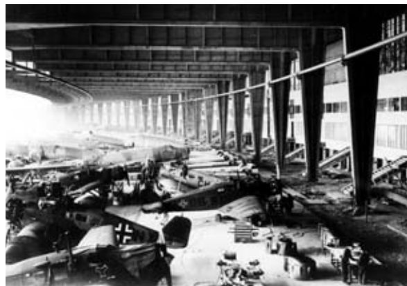
Rüstungsproduktion am neuen Flughafen, 1940/41

Die Texte der Ausstellung sind durchgehend zweisprachig (Deutsch/Englisch). Die kostenlose App „Projekt Flughafen Tempelhof“ stellt die Texte zusätzlich in Arabisch, Französisch, Russisch und Spanisch zur Verfügung. Sie ist im App Store und im Google Playstore erhältlich.