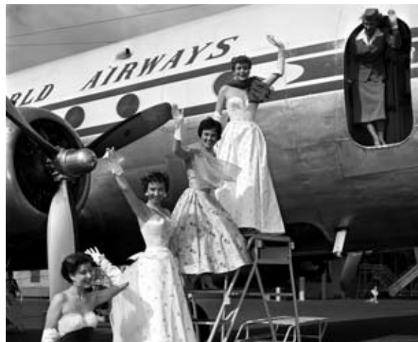
Modenschau auf dem Tempelhofer Flugfeld, 1954

Flughafen Tempelhof, um 1930